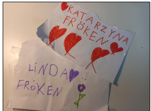
Ett av barnen i Gävle gav oss namnlappar.

dockmakare, manusförfattare, musiker och skådespelare och tillsammans med henne har vi gjort skuggteater och planerar för dockteater i grupperna.