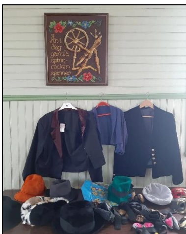
Kostymer att använda till olika scener.