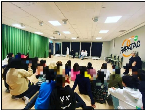
Ungdomarna håller workshop på Rapatac.