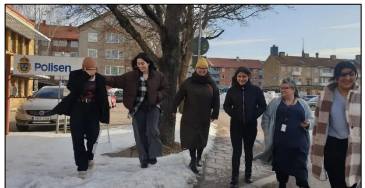
Här har vi precis sökt polistillstånd för demonstrationen Barn mot vuxnas krig

Demonstrationen hölls utanför Kulturcentrum och bestod av tal och sång på olika språk, samt musik. Syftet med demonstrationen var att uppmärksamma barn i krig oavsett land.