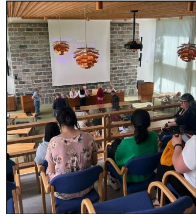
På kommunfullmäktige. Ungdomarna visste inte att de skulle få ett pris.

Spelet ökar kunskapen om konventionen hos den målgrupp som den faktiskt berör, barn och unga, vilket gör DramaMera till värdiga mottagare av årets demokratipris."